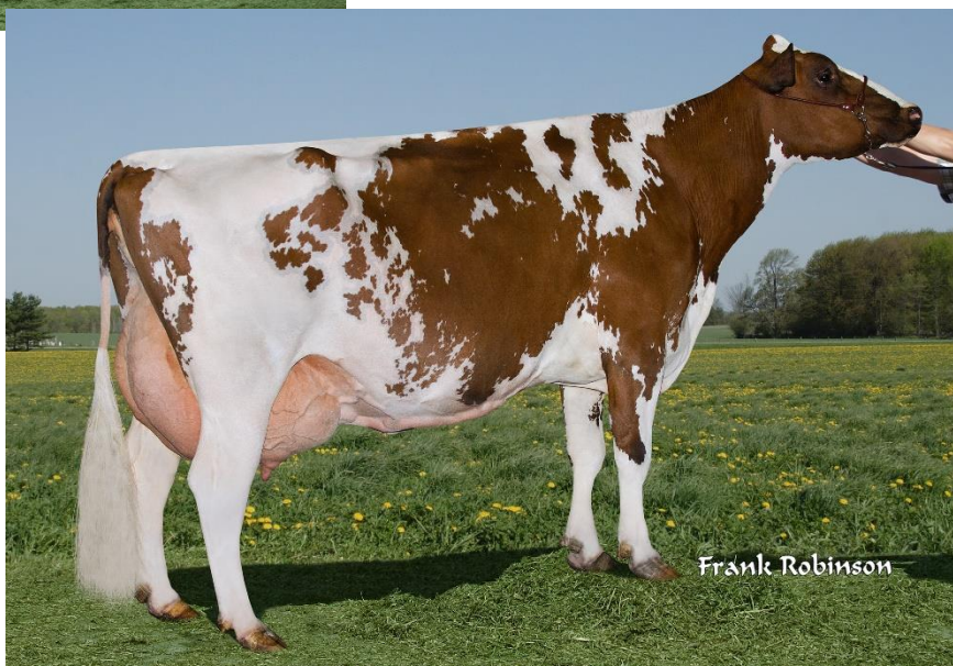
Mapleburn Loreal EX-93-4E

Moision Rosabellan suku on tuttu monelle Kanadan matkaajalle, sillä Mapleburnin tilalta ovat suomalaiset ostaneet paljon alkioita. Yksi alkioemistä oli Mapleburn Loreal, joka hurmasi kävijät upealla olemuksellaan ja huikealla tuotoksellaan. Lorealin alkioista on syntynyt useampia tyttäriä Suomeen ja näistä kaksi täyssiskoa, Mapleburn Cal Helix ET ja Mapleburn Cal Isabella ET, myytiin peräkkäisinä vuosina Sale of Stars-huutokaupassa huippuhinnoin. Moision karjaan ostettiin edellä mainituista Isabella ET, josta saatiin useampia tyttäriä, mm. Moision Rosabellan emä Nigella. Nigella on luokitettu nyt ensikkokaudellaan hienosti AF-GP82, sen emä Isabella ET on lypsänyt toisella kaudellaan 10525 kg ja kolmas emä, Mapleburn Loreal, onkin sitten todellinen maitokone: Loreal lypsi heti ensimmäisellä kaudella 11226 kg ja parhaalla kaudellaan 16556 - 3,5 - 3,1, sekä sen jälkeenkin kahdella peräkkäisellä kaudella yli 14-tn kausia. Lorealin elinikäistuotokseksi kertyi kuudelta kaudelta yhteensä 106 237 kg! Saman lehmäperheen edustaja Moiossa, Isabella ET:n tytär Moision Burbella, voitti Ayrshiren Farmikilpailun nuorimpien hiehojen luokan kesällä 2019.