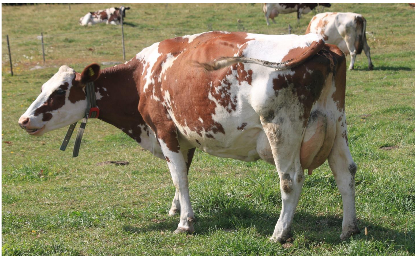
Savinnan LadyGaga-AF-VG85 kolme kertaa poikineena

Isä: Forever Schoon Predator ET Emä: Savinnan LadyGaga-AF-VG85, paras 305 pv 10041 - 4,37 - 3,49 (2.) Emänisä: Savinnan Hurmaava (Des Chamois Poker ET x Kellcrest Ice Man ET) Emänemä: Uusi-Suon Vanessa-AF-GP83 EEI: McCornick Nelson ET EEE: Uusi-Suon Pandora-AF-GP80 EEEE: Uusi-Suon Lazarella, ensimmäisen Farmarin 1999 Ayrshire Champion!