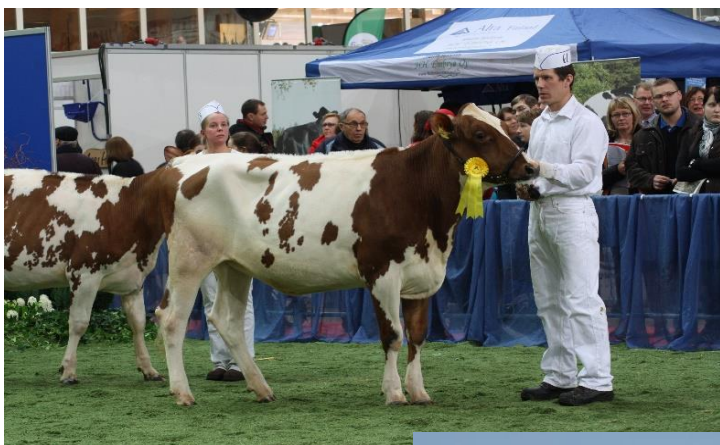
Mapleburn Cal Isabella ET hiehona Ayrshire Winter Show'ssa

Isä: Lessard Jumper Emä: Moision Nigella-AF-GP82 Emänisä: Duo Star Pokerstars Emänemä: Mapleburn Cal Isabella ET, paras 305 pv 10525 - 3,94 - 3,17 (2.) EEI: Margot Calimero EEE: Mapleburn Loreal EX-93-4E, paras 305 pv 16556 - 3,5 - 3,1 (3.), elinik. 106-tn EEEE: Mapleburn Remington ET